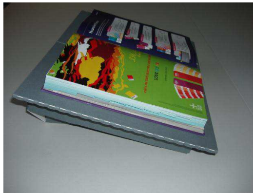
Inclinaison basse 15°