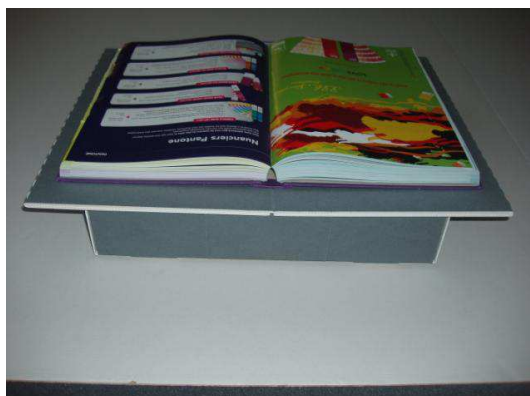
Position à plat vue de dos