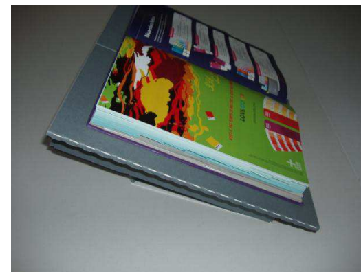
Inclinaison haute 25°