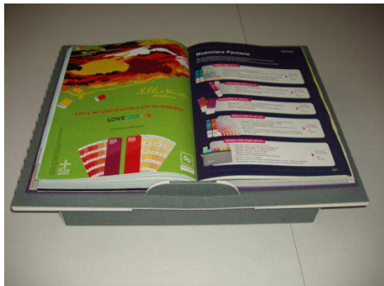
Position à plat