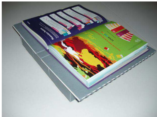
Position à plat